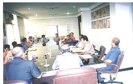
Audiensi Koalisi Masyarakat Sipil Untuk Kasus Abepura di Kejagung 11 September 2002: Kontrol independensi Lembaga Yudikatif, Dok. PBHI, 2002

Menurut UU Pengadilan HAM No. 26/2000, setelah mengalami perpanjangan waktu, Kejaksaan Agung harus sudah menyerahkan berkas perkara itu ke pengadilan. Tapi hingga batas waktu tersebut, Kejaksaan tidak juga menyelesaikan tugas penyidikannya. Strategi buying time dalam penanganan kasus ini nampak sekali dengan dihabiskannya semua peluang dalam UU 26/2000 tentang perpanjangan waktu penyidikan. Di samping itu juga muncul berbagai alasan teknis yang tidak substansi tentang sulitnya menembus birokrasi kepolisian, anggaran penyidikan, dan lain sebagainya, yang membuat proses penyidikan itu terhambat.